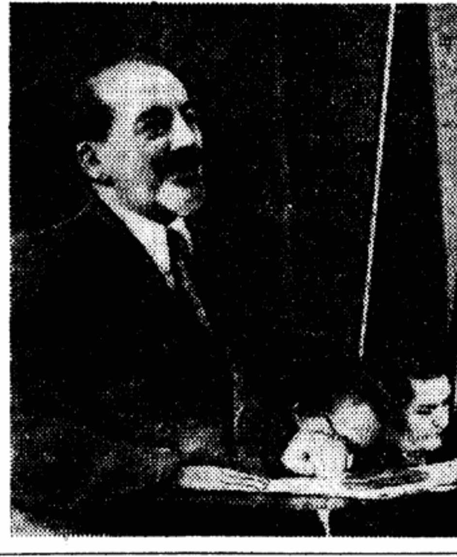
СЕГОДНЯ — ДЕНЬ НЕЗАВИСИМОСТИ ИНДОНЕЗИИ