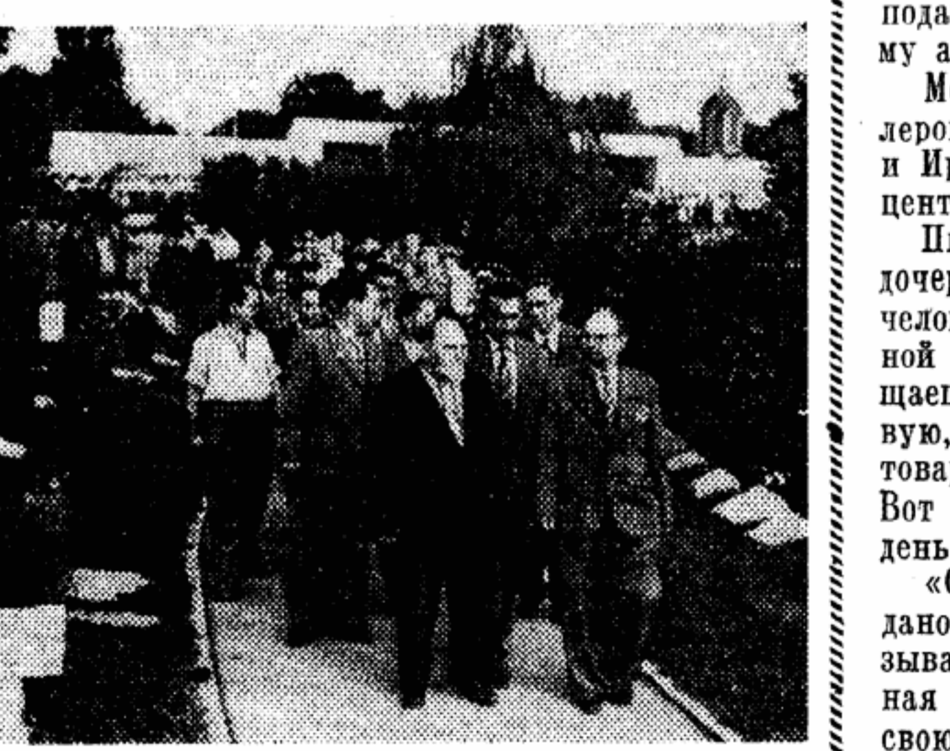
Советская делегация возложила венки на могилы советских и югославских воинов — освободителей Белграда.

Позже я подошел к группе мужчин, которые рассматривали старые фотографии и обменивались замечаниями: говорили о том, что марокканские полки Франко были нигде не годным сбродом, что «следовало повстанить к стене гораздо больше красных».